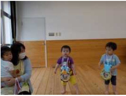
お誕生日おめでとう♪