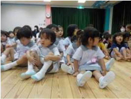
最後にみんなで♪七夕まつり♪の歌をうたいました。